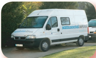
1. Véhicule du Samu Social de Paris