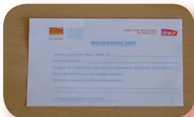
2. Le carton d'invitation à rejoindre l'ESI