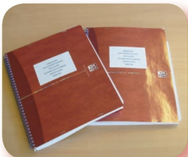
4. La main-courante de Paris Nord et Paris Est